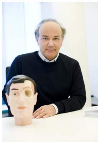
THOMAS MUEHLBERGER 教授

偏头痛手术是治疗急性偏头痛的一种治疗方法，由 Muehlberger 教授于 2000 年在美国偶然发现。在过去十年中，Muehlberger 教授及其欧洲团队已为全球超过 3,000 名偏头痛患者进行了治疗，每月进行约 30 例手术。对于 Muehlberger 教授的患者而言，手术显著提高了他们的生活质量。超过 90% 的患者表示工作效率提高了，社交互动也得到了改善。超过 50% 的患者在手术后一年内偏头痛症状完全缓解。另有 40% 的患者偏头痛发作的频率和疼痛强度减少一半以上。